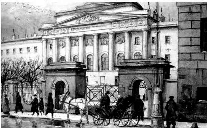
Рис 1.1. Московский университет

Первый Московский университет (рис. 1.1) был учрежден 12 января 1755 г. и имел три отделения, или факультета: юридический, медицинский и философский. На философском факультете работали четыре преподавателя: профессор философии, который должен был также обучать студентов логике, метафизике и нравоведению; профессор физики, обучавший физике экспериментальной и теоретической; профессор красноречия, обучавший ораторскому искусству и стихотворчеству; профессор истории русской и всеобщей. Психологии в качестве отдельного предмета в цикле философского факультета первого русского университета не было.