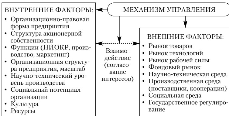
Рис. 1.1. Направления воздействий механизма управления

Механизм управления следует рассматривать как составную (наиболее активную) часть системы управления, обеспечивающую воздействие на факторы, от состояния которых зависит результат деятельности управляемого объекта. Факторы управления для предприятия могут быть внутренними (тогда речь идет о механизме управления предприятием) или внешними (тогда речь идет о механизме взаимодействия с другими предприятиями и организациями) (рис. 1.1). Для предприятия предпринимательского типа характерно стремление к изменению состояния внешней